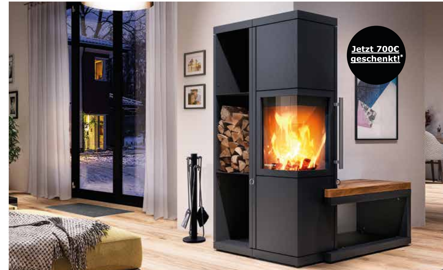
Kaminofen LIVERA 4 kW oder 8 kW Leistung DIBt zertifiziert, einteilige Eckscheibe, mit Regal- und Bankelementen kombinierbar