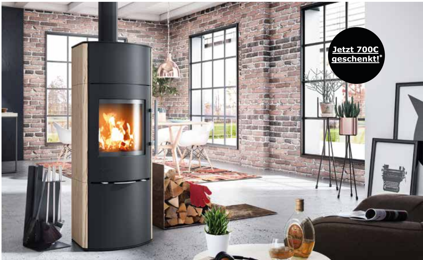
Kaminofen GARDA Plus 4 kW oder 8 kW Leistung mit Holzfachschieblade inklusive Soft-Close-Technik erhältlich, DIBt zertifiziert, elektronische Abbrandsteuerung fire+ optional

» Mit Speicherringen aus DROOFFolith machen Sie unsere Stahllöfen zu kleinen Speicherwundern. «