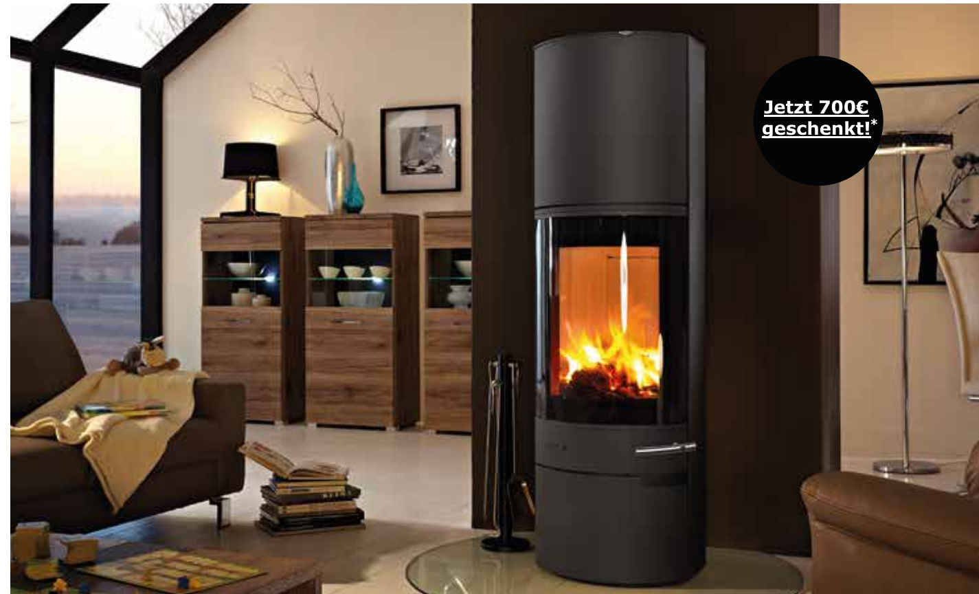
Kaminofen LOVERO 2 4 kW oder 8 kW Leistung DIBt zertifiziert, gusseiserne Tür