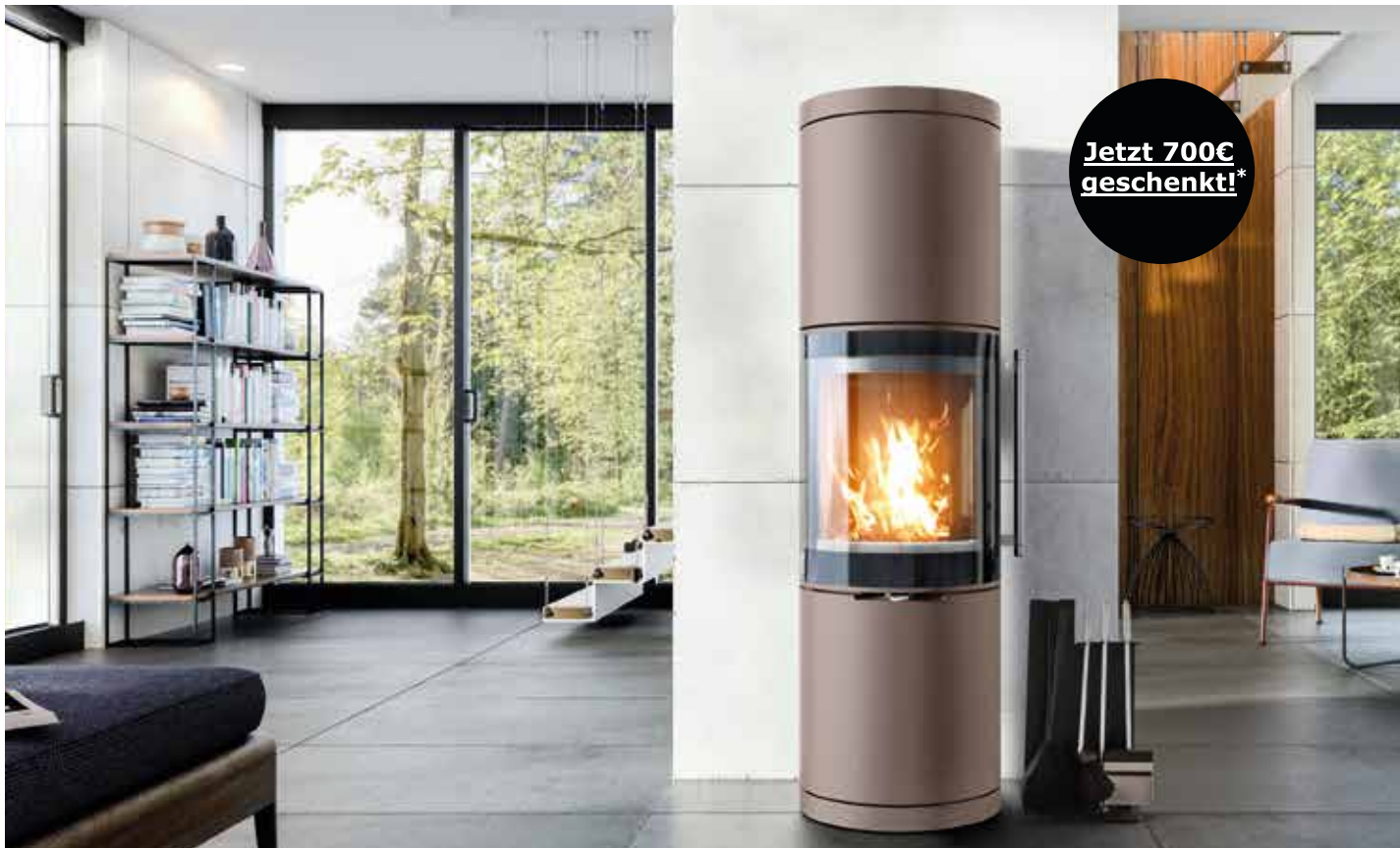
Kaminofen BRUNELLO 4 kW oder 8 kW Leistung auch in Sonderlackierung palladium erhältlich, DIBt zertifiziert, 180° Panorama-Tür, elektronische Abbrandsteuerung fire+ optional